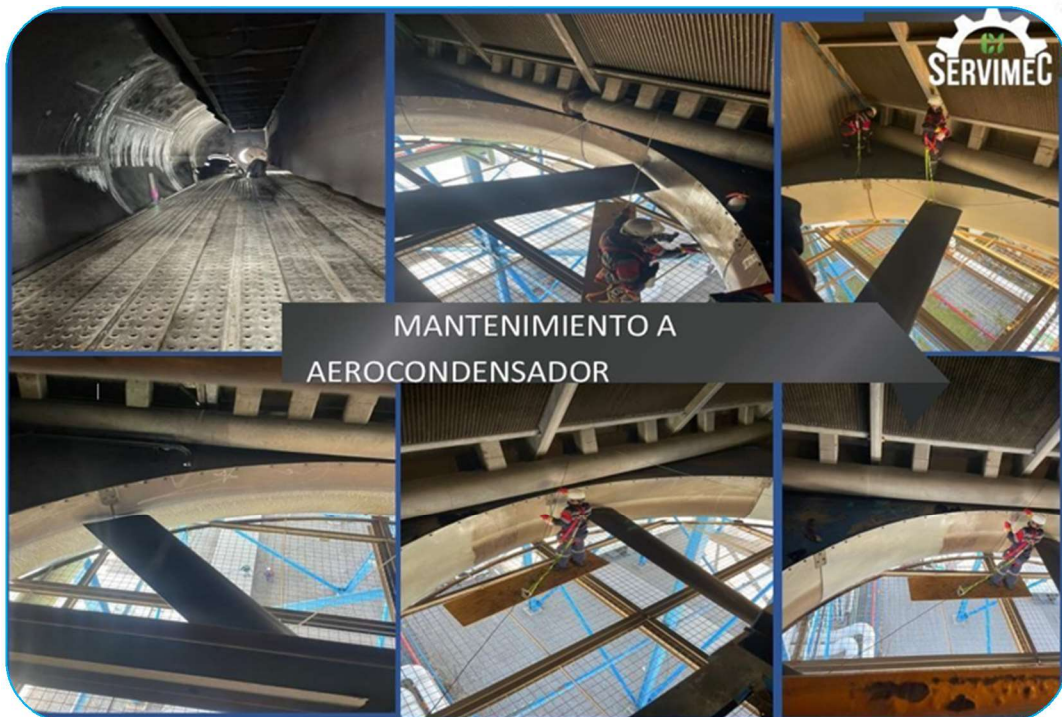
MANTENIMIENTO A AEROCONDENSADOR